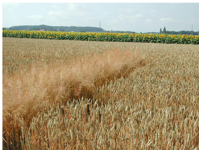
Témoin de traitement herbicide dans les céréales.