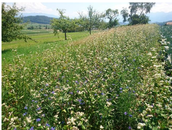
Figura 3: Strisce per organismi utili nelle colture di cavolo

*** Secondo la PER, alle strisce per organismi utili si applica una pausa di coltivazione di due anni nello stesso luogo come per le altre colture campicole.