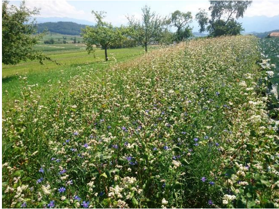
Figure 3 : Bandes d'insectes utiles dans une culture de chou.